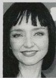
María de Medeiros